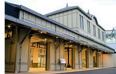
JR折尾駅まで徒歩15分

ユニクロ、ヤマダ電機他 商業施設の立ち並ぶ人気の 折尾地区にクリニックビル誕生!!