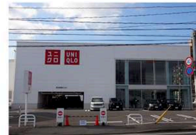
ユニクロ折尾店まで徒歩3分