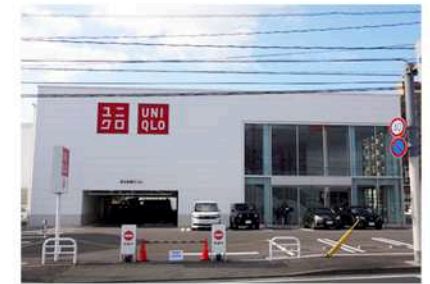
ユニクロ折尾店まで徒歩3分