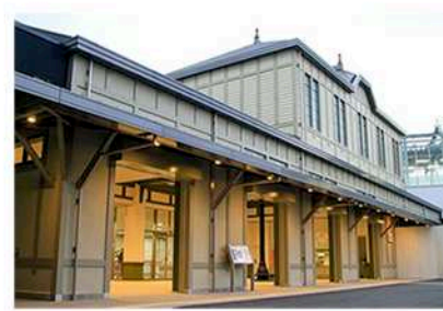
JR折尾駅まで車で4分